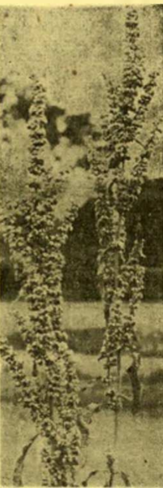
Este fructífero ejemplar corresponde a una de las especies más comunes de romaza. Por sí sola, este penacho es capaz de infestar todo un campo.

En las tierras de cultivo predominan las primeras, las de mayor porte; su presencia se denuncia a distancia por la particularidad del vistoso central, siempre erguido.