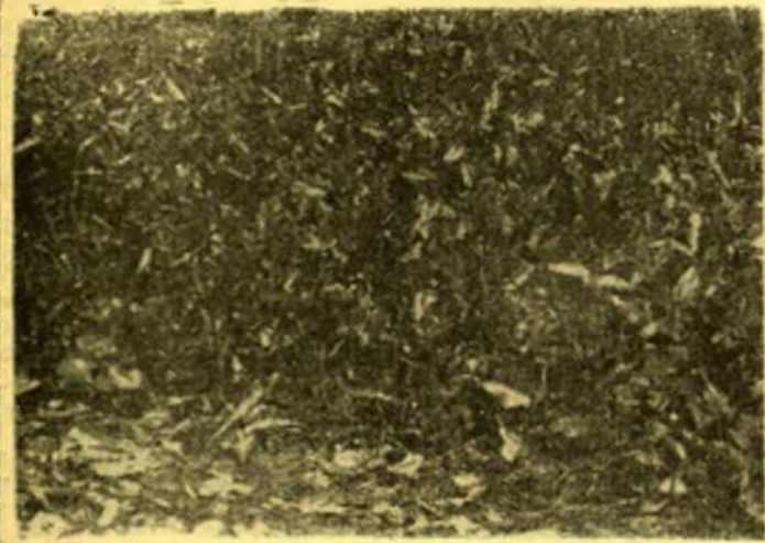
He aquí una tierra plagada de romaza. ¿De dónde llegó? Lo cierto es que la solución sólo está en el arado.